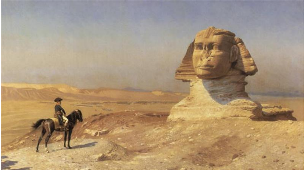
Figuur 1 Jean Leon Gerome - Napoleon Bonaparte bij Sphinx tijdens de Egyptische expeditie in 1798. Gepubliceerd in 1868