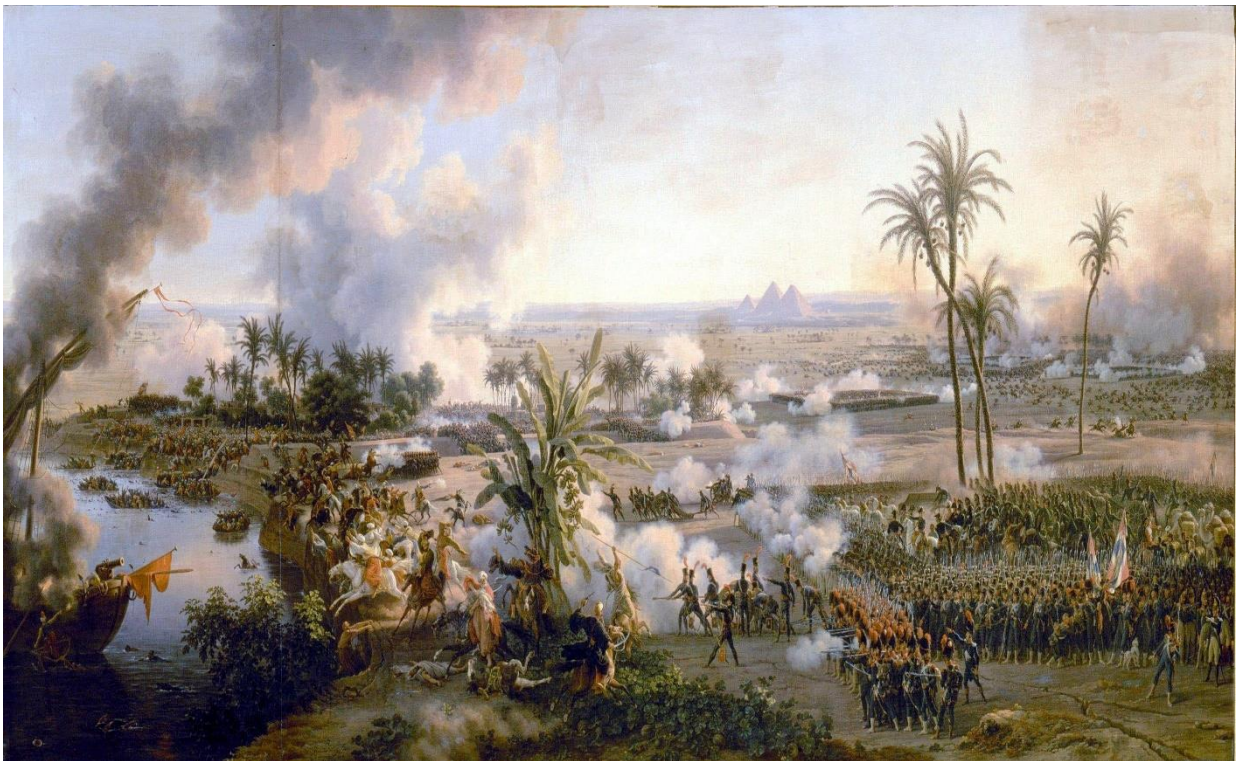
Figuur 2 Louis-François Baron Lejeune - Gevecht om de Piramides - 1808

Napoleon wilde met deze expeditie meer grip krijgen op de handel in het Midden-Oosten. Via Egypte zou hij richting India kunnen trekken. Het heeft echter anders moeten zijn. Engeland snijdt Napoleons vloot af, waardoor zijn mogelijkheden erg beperkt worden. In 1799 vertrekt Napoleon terug naar Frankrijk om daar de macht te grijpen. Zijn generaals nemen de taken over, maar moeten hun meerdere erkennen in Engeland en sluiten op 1 oktober 1801 een voorlopig vredesverdrag. De expeditie heeft niet te gewenste resultaten opgeleverd die Napoleon voor ogen had.